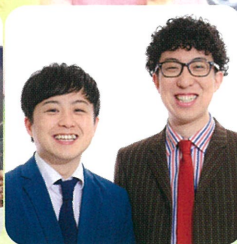
ドーナツ・ピーナツ